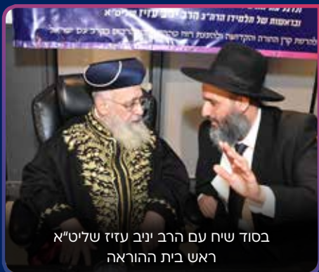
בסוד שיח עם הרב יניב עזיז שליט"א ראש בית ההוראה