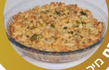
החטבת חירב חלכה