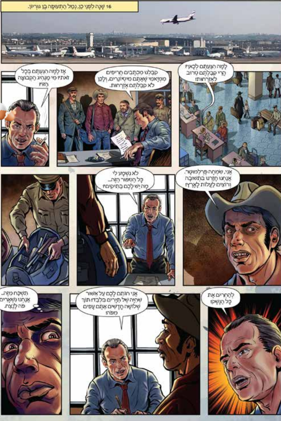
את הסיפור המלא ניתן להשיג בתנויות הספרים המובחרות