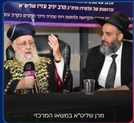
מרן שליט"א במשאו המרכזי