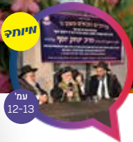
מרתן הראש"ל בבית ערוץ 2000 תיעוד היסטורי

"לעולם ישלים אדם פרשיותיו עם הציבור, שניים מקרא אחד תרגום, ואפילו עסרות ודיבן (שאין בהם תרגום), שכל המשלים פרשיותיו עם הציבור מארכין לו ימיו ושנותיו."