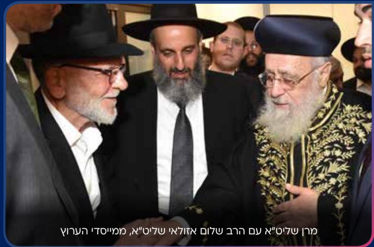
מרן שליט"א עם הרב שלום אזולאי שליט"א, מייסדי הערוץ

כסינחא דשמיא ברוכים הבאים בשם ה' מקדמים בברכה את פני מורנו ורבנו ועטרת ראשנו, הגאון הגדול בעל ה"ילקוט יוסף" הרב יצחק יוסף שליט"א מרן הראשון לציון הרב לכבוד ביקורו המיוחד לפאר כבוד את משכן ארגון הקירוב ערוץ 2000 והאולפנים החדשים ולרגל פתיחת בית ההוראה 'מענה ההלכה' בנשיאותו ובראשות של תלמידו הרה"ג הרב יניב עזיז שליט"א 'הא בואי להרמת קרן התורה והקדושה ולהפצת רוח טהרה ויחי הרבים בקרב עם ישראל'