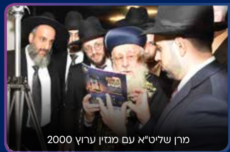
מרן שליט"א עם מגזין ערוץ 2000